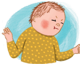
Erhöhte körperliche Bewegung