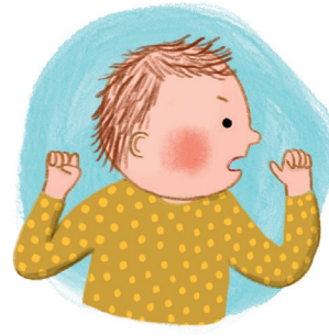
Kopf drehen, (die Brust) suchen