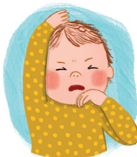
Starke körperliche Unruhe