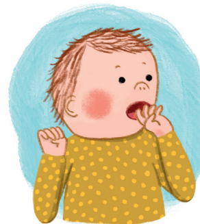
Hand zum Mund führen